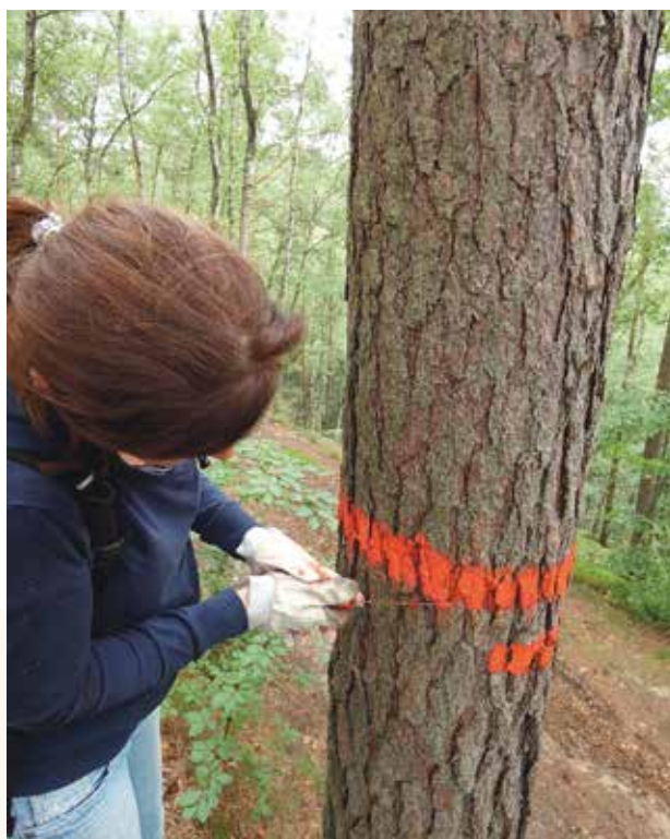
Firemní dobrovolníci v Klubu českých turistů

Největší úspěch mělo tradičně pomáhání přírodě a životnímu prostředí ve spolupráci s Českým svazem ochránců přírody, ekologicky zaměřenými neziskovkami, s Klubem českých turistů, s českými národními parky a mnoha dalšími organizacemi. Dále jsou u dobrovolníků nejoblíbenější aktivity v organizacích, které se starají o chráněná či raněná a opuštěná zvířata: záchranné stanice a útulky, následně bioparky, ekocentra, zooparky a velké ZOO v Liberci a ve Dvoře Králové. Narůstá i zájem o aktivity s dětmi, seniory a zdravotně postiženými klienty.