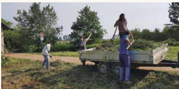
Firemní dobrovolníci v ČSOP JARO Jaroměř