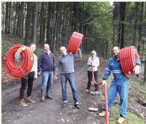
Firemní dobrovolníci v Klubu českých turistů

Máme radost, že rok od roku více společností zařazuje firemní dobrovolnictví do své firemní kultury, a to nejen jako součást společenské odpovědnosti či firemního PR, ale také jako součást podpory rozvoje zaměstnanců a péče o ně. Dnes již také není výjimkou, že pracovní týmy volí dobrovolnický den jako smysluplnou alternativu ke klasickému teambuildingu.