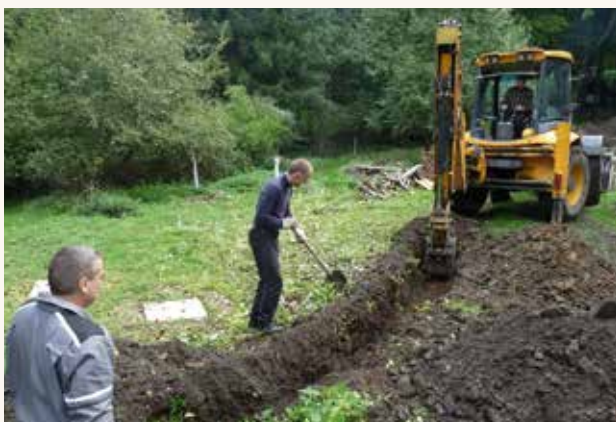
Firemní dobrovolníci v Klubu českých turistů