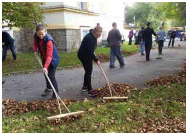
Firemní dobrovolníci v Olivově dětské léčebně

Máme také radost, že mezi neziskovými organizacemi přibývá těch, které si uvědomují potenciál firemního dobrovolnictví a snaží se vyjít vstříc a připravit se tak, aby mohly pomoc ze strany firem co nejefektivněji využít. Na první pohled to někdy může znamenat více starostí a příprav, ale přínosy a množství práce, kterou jsou firemní dobrovolníci schopni odvést, vše spolehlivě kompenzují. Se zvyšujícím se zájmem o CSR se koná čím dál více konferencí a seminářů týkajících se firemního dobrovolnictví, valná většina z nich je ovšem zaměřena na firmy. V únoru jsme uspořádali workshop Jak na firemní dobrovolnictví s cílem pomoci neziskovému sektoru v této oblasti. Zúčastnilo se jej více než 20 organizací.