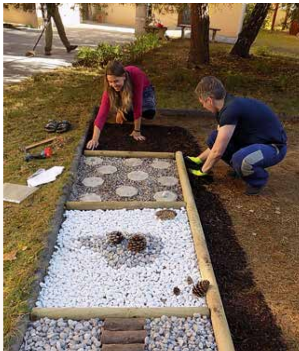
Firemní dobrovolníci ve Stacionáři Človíček

„Den pro dobrý skutek byl velmi užitečný. Opět mi svět připomněl, že mám být vděčna za své zdravé dítě.“