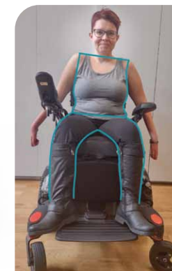
postura na původním sedáku