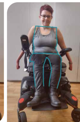
korekcje postury s Libella Seat Varia