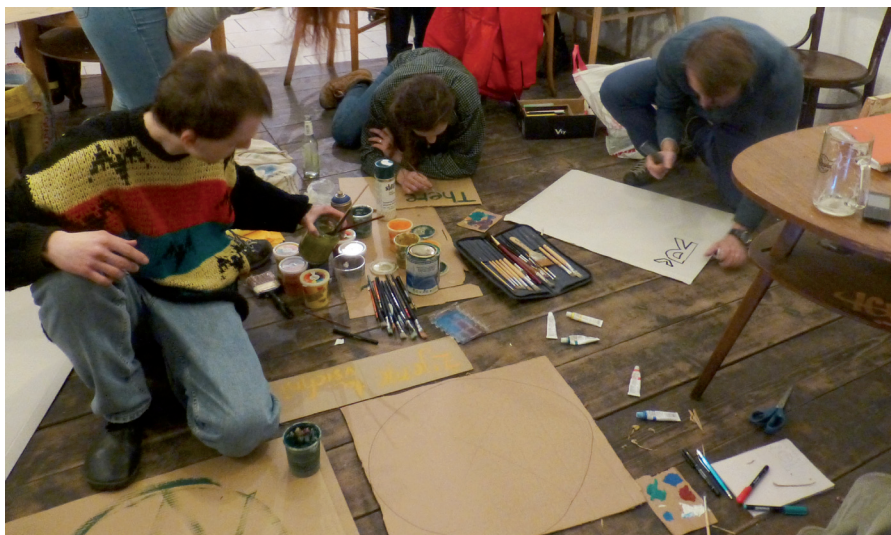
Obr. 3 Spoločná výroba transparentov zorganizovaná lokálnou bunkou FFF.