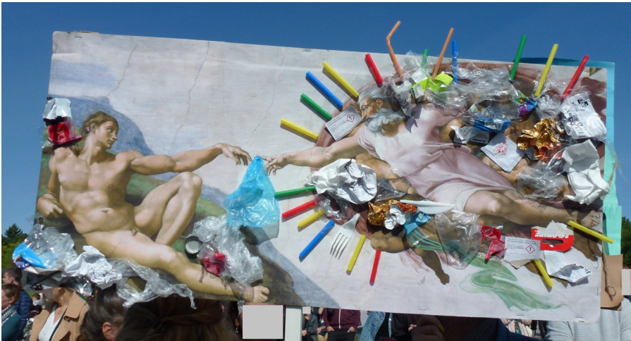
Obr. 2 Stvorenie Adama. Vizuálny transparent dáva do kontrastu ľudské umenie s ľudskou schopnosťou ničiť.