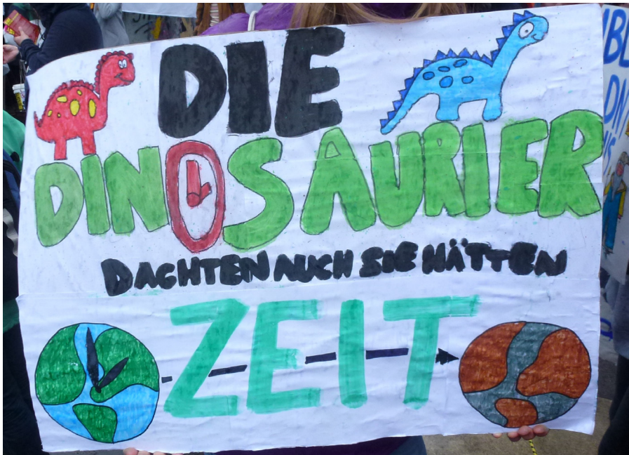
Obr. 4 Aj dinosaury si mysleli, že majú čas. Variant jedného z globálne rozšírených hesiel. Doplnený o motívy plynutia času a premeny Zeme pod vplyvom klimatických zmien.