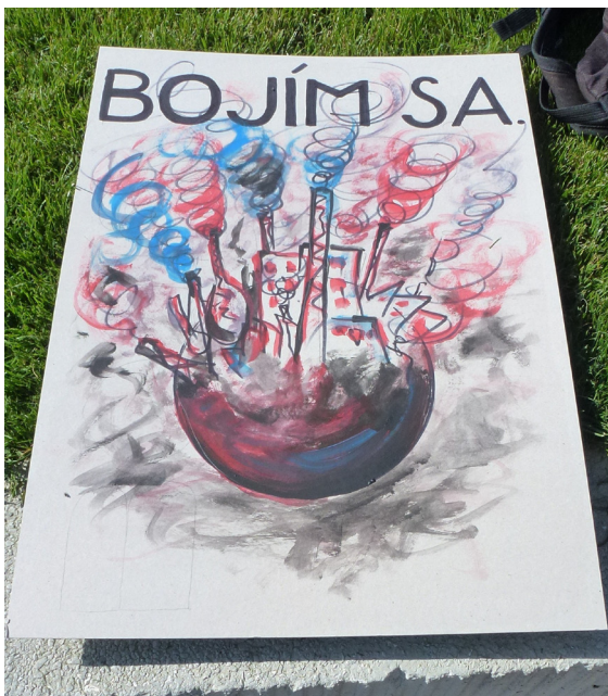
Obr. 5 Bojím sa! Vyjadrenie súčasného pocitu z vidiny budúcnosti. Bratislava, 20. 9. 2019.