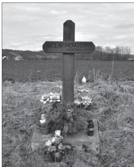
Obr. 4. Pomníček u silnice na Hořovicku si po dobu sedmi let udržel stabilní podobu a byl stále navštěvován (vlevo fotografie z první vlny výzkumu, vpravo fotografie z druhé vlny výzkumu).