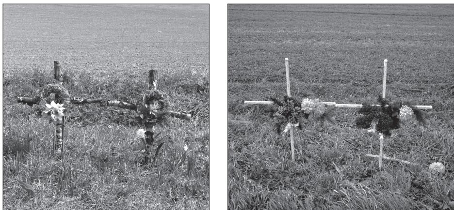
Obr. 3. Křížky zbudované na paměť dvou obětí na Příbramsku. Vlevo původní dřevěná podoba, vpravo novější kovové kříže, které je po letech nahradily. 16. 4. 2005 a 11. 12. 2013.

událostech, například při výročí smrti, popřípadě v souvislosti s „dušičkami“, tedy svátkem zesnulých. Výzkum potvrdil, že právě výročí úmrtí, „dušičky“, Vánoce a popřípadě i Velikonoce jsou příležitostmi, kdy pozůstalí pomníčky u silnic pravidelně navštěvují.