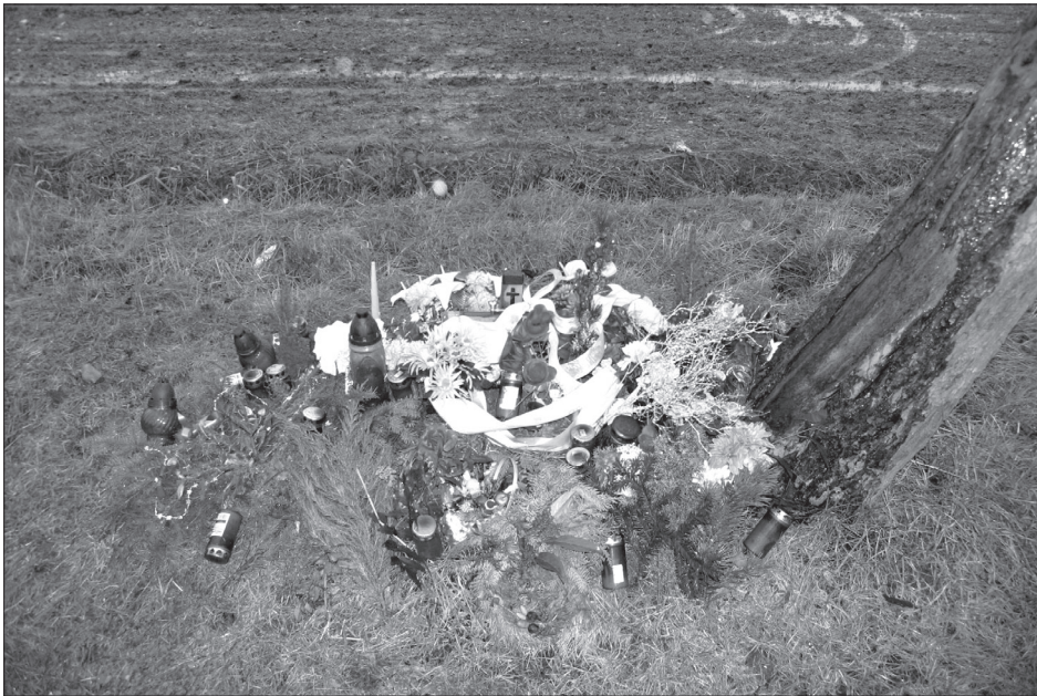
Obr. 1. Volně položené předměty na místě smrtelné dopravní nehody na Kladensku.