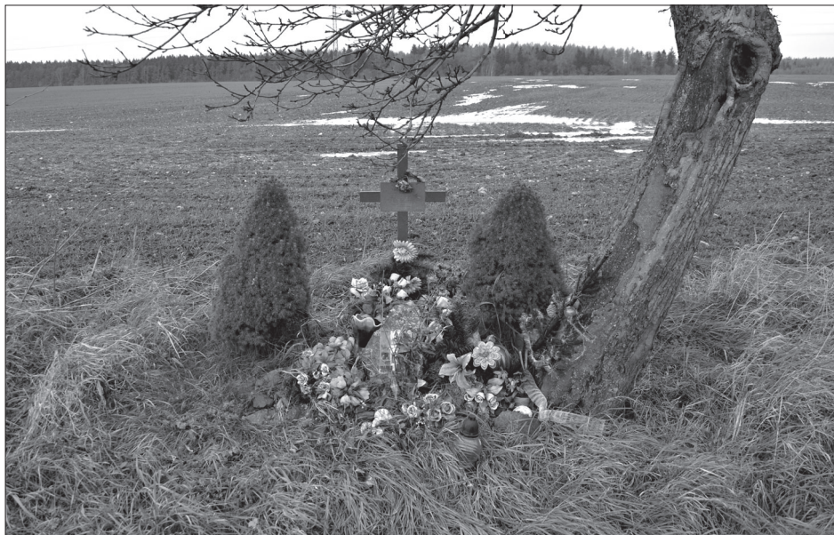
Obr. 2. Pomníček zbudovaný na místě smrtelné nehody mladíka na Kladensku. (Stejné místo jako na obr. 1 zhruba po sedmi letech.)

a květy. Na základě provedeného výzkumu není možné zjistit, ve kterých případech se pozůstalí rozhodnou pro vybudování trvalejšího pomníčku a kdy ne. Pravděpodobně v tom hraje roli mnoho faktorů, zejména osobních a místních, i okolností dané nehody.