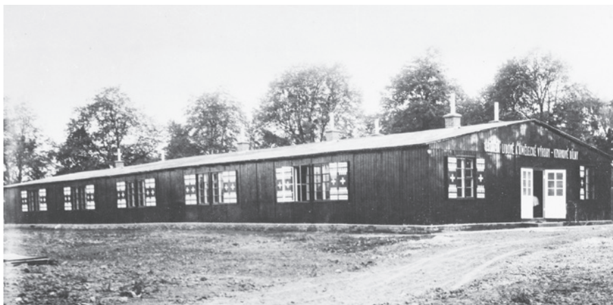
Obr. 4 Novostavba vzorkových dílen ÚLUV v Uherském Hradišti.

Jako ideální lokalita pro „spádovou oblast“ Slovácka a Valašska bylo vybráno Uherské Hradiště (Šenfaldová 1980). Dílna měla podobu přízemního dřevěného pavilonu. Byl využit již stojící objekt, přenosný, normalizovaný k využití pro vojenskou správu (v tehdejší době byla v majetku družstva SLUM) a stavba se nacházela na pozemcích města, které je pronajalo Ústředí za vskutku symbolickou cenu 50 Kčs ročně. V okolí dílen však vše neprobíhalo tak hladce a některé pozemky bylo třeba vyvlastnit jejich původním majitelům. Vybavení dílny bylo částečně z druhé ruky a pocházelo z poválečných konfiskátů. Provoz byl slavnostně zahájen 11. října 1947 a jak se pravilo v protokolu z návštěvy místa ještě před jeho zprovozněním, „ poměr veřejnosti k zamýšlené manufaktuře díky rázovitosti kraji a slováckého regionu “ byl kladný. 35 Náklady na koupi budovy a veškeré vybavení mírně překračovaly 800 000 Kč. (Obr. 4, 5)