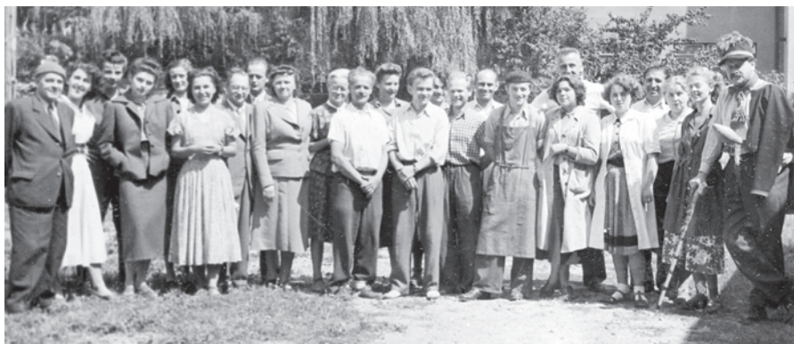
Obr. 5 Skupina pracovníků vzorkové dílny v ÚLUV v Uherském Hradišti kolem roku 1949. Zdroj: ANM, ÚLUV, K_03337.

Spiritem agens dílen se stal Ing. arch. Miroslav Bouček (Drápala 2008). Svěřené úkoly byly široké, počínaje evidencí výrobců a potřeb místní lidové a umělecké výroby, vč. mapování jejich technických potřeb přes vytváření nových vzorů až k odbornému průzkumu celé oblasti. Právě zde můžeme sledovat první stopy jednoho z budoucích klíčových fenoménů spojených s činností ÚLUV, a sice terénním etnografickým výzkumem. 36