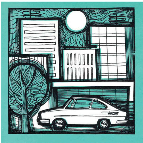
Obr. 8 Vizualizace normalizační společenské smlouvy: Škoda 110R a byt v panelovém domě jako záruka sluncem zalitých dní. Z přehledu plnění volebního programu NF v Pardubicích za léta 1971–1975.