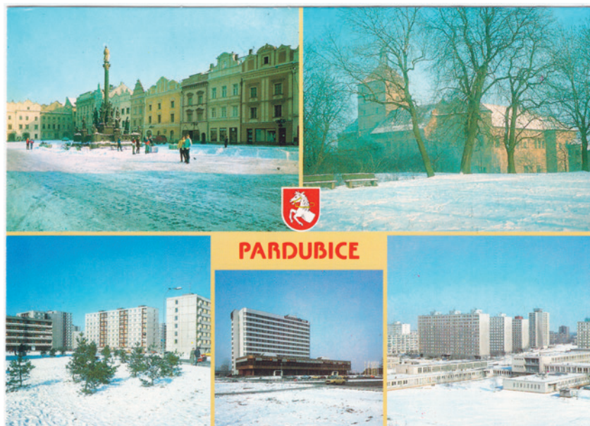
Obr. 5 Zimní ráj socialistických Pardubic: Pernštýnské náměstí a zámek v protikladu k běloskvoucí zástavbě Dubiny I, Polabin III a Interhotelu Labe. L. Fišer a Josef Svatoň, 1985.