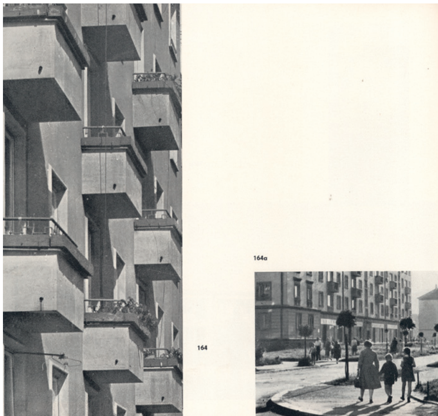
Obr. 3 Sídlíště Dukla očima Slávka Pravce, 1966.