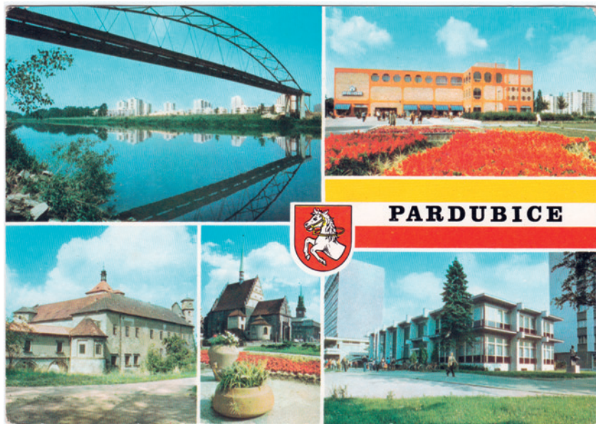
Obr. 4 Neúprosný diktát modernity: oblíbený průhled na Polabiny IV pod mostem přes Labe, Prior a spořitelna v protikladu k zámku a kostelu sv. Bartoloměje. Antonín Holub, 1980.