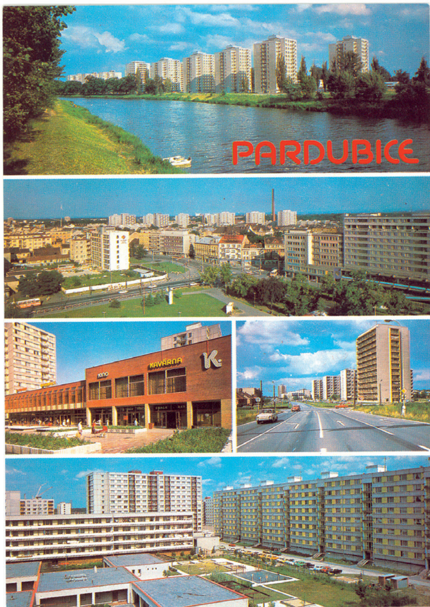
Obr. 6. Výdobytky socialistické výstavby Pardubic je třeba se pochlibit! Vedutistické záběry sídlišť Závodu Míru a Karloviny střídají detaily z Karloviny, Drážky a Dubiny. L. Fišer, 1985. Zdroj: Sběrka VČM.