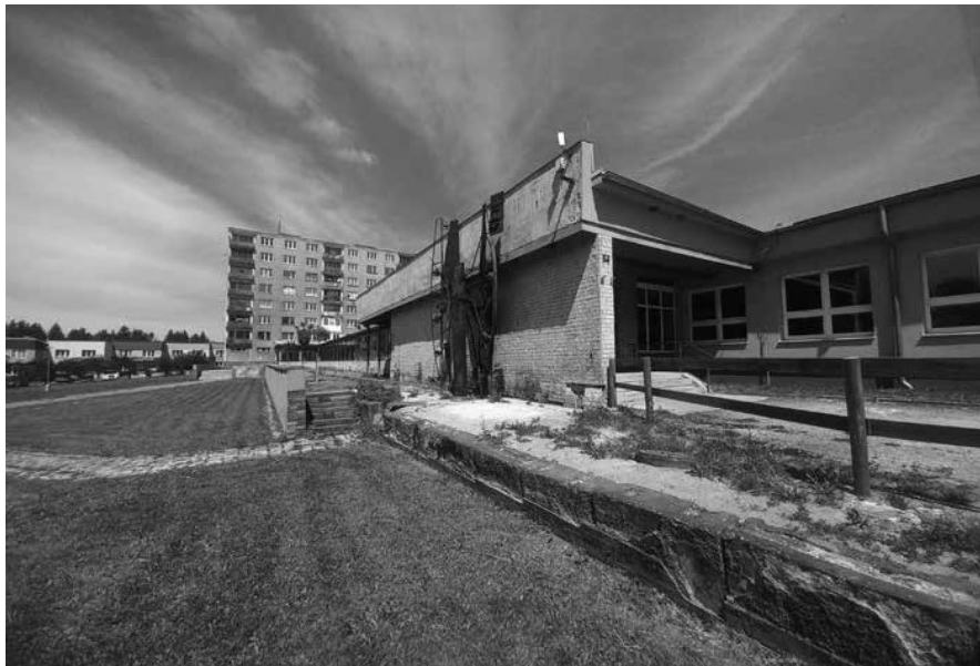
Obr. 1. Současná podoba zástavby experimentálního vesnického sídla Rovná (okr. Sokolov). V popředí budova občanské vybavenosti, v pozadí jeden z výškových panelových domů a část řadových rodinných domů.