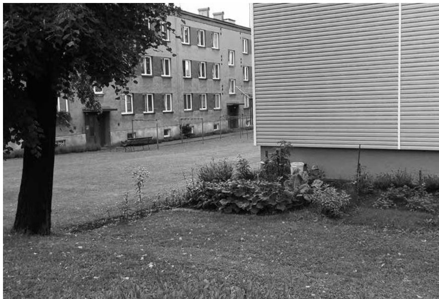
Obr. 3. I v současnosti obklopují některé vesnické bytové domy zahrádky drobnopěstitelů z řad zdejších obyvatel. Kozlovice (okr. Frýdek-Místek). Foto D. Drápala, 2021.

komplexu, není naplnění těchto očekávání již jakkoliv reálné. 87 Míra adaptability byla závislá také na užitém stavebním materiálu. Bytové domy stavěné na bázi cihelného zdiva nekladly dispozičním úpravám takové překážky jako objekty budované z panelových prefabrikátů.