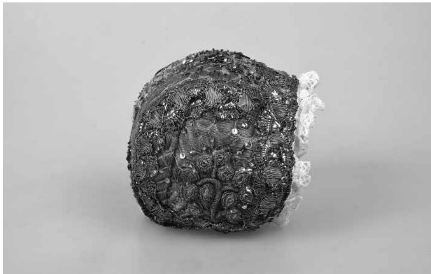
Obr. 3. Zlatý křestní čepiček, 1. pol. 19. století. Muzeum Vysočiny Pelhřimov, inv. č. T959. Foto H. Zrno Vondrů.

né využití interiérové textilie. Přestože se na všech částech nachází vytlačené rýhy, jež jsou zřejmě pozůstatkem po stuze či prýmku, není jisté, zda byl čepiček skutečně používán jako křestní. Rezné plátno, kterým je podloženo, nese stopy častého užívání. Současně je čepiček velmi drobný, jistě byl určen novorozenci.