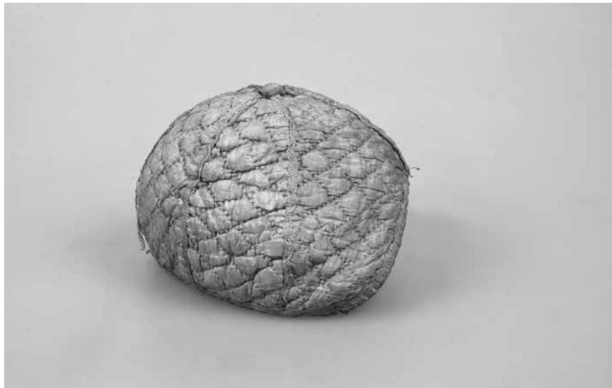
Obr. 6. Hedvábný prošíváný křestní čepček, 2. pol. 19. století. Muzeum Vysočiny Pelhřimov, inv. č. T961.

Zmínit je třeba také čepčky, které svou výzdobou odkazují na horácké, či přímo pelhřimovské krojové součásti. První z nich, uložený v Etnografickém oddělení NM, pochází z první poloviny 19. století. 70 Je ušit z bílého atlasu, zdoben bordurou, pomněnkovými kvítky a hvězdici na dýnku. Výšivky jsou provedeny zlatým dracounem, flitry a bullionem. Svým střihem připomíná měkké horácké čepce. 71 Druhým je dýnkový bavlněný čepček z 1. poloviny 20. století, zdobený bílou dírkovou výšivkou. 72 Zatímco atlasový čepček sloužil jako křestní, bavlněný byl zřejmě určen k běžnému nošení.