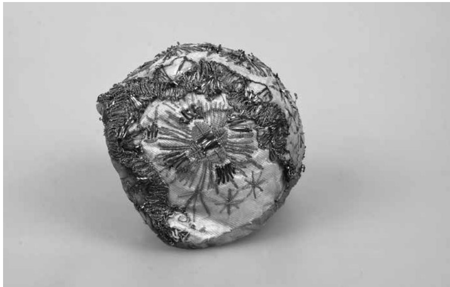
Obr. 4. Hedvábný křestní čepiček, 19. století. Muzeum Vysočiny Pelhřimov, inv. č. T955.

zřejmě vatová výplň. 64 Všechny švy i okraje jsou překryty velmi úzkými prýmkami, na spoji švů, tedy na vrcholku čepičku, je připevněna malá bambulka.