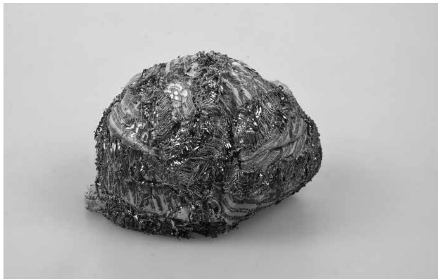
Obr. 2. Brokátový šestidílný křestní čepceček, polovina 19. století. Muzeum Vysočiny Pelhřimov, inv. č. T962.

z první poloviny 19. století z brokátu, na němž je zlatými nitěmi vytkán motiv plátkových květů (Obr. 2). 53 Švy i okraj obličejové části jsou překryty zlatými paličkovanými krajkami, tvořenými dracounovou nití a lamelami, zapracovanými do vějířovitého motivu. 54 Postranní díly jsou opatřeny florální plastickou výšivkou ze stříbrného i zlatého bullionu a rozmanitých typů ražených plíšků. V temenní a týlní části středního pruhu jsou vyšity kytičky z bullionu, flitrů, kovových kuliček. Středou dvou květů tvoří malé rudé sklíčko připomínající český granát. Přestože čepceček nese všechny výše diskutované ochranné prvky, je třeba na něj pohlížet v kontextu ženských zlatých dýnkových čepců (zlatohlavů), které byly užívány ženami z vyšších sociálních vrstev venkova i měst po celém území českých zemí, na Horácku byly nicméně zvláště oblíbené. 55