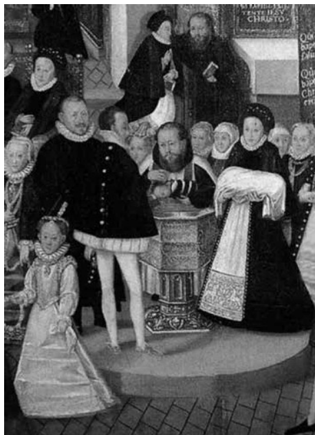
Obr. 1. Křest dítěte ve šlechtické rodině. Výřez z Žerotínského epitafu, 2. pol. 16. století. Národní památkový ústav – Územní památková správa na Sychrově, inv. č. OP02621.

Křestní oděv tvořený otevřenou košilí, resp. pláštěm s kapucí byl nadále užíván po celý raný novověk. O používání uvedeného typu křestního oděvu v 17. a 18. století svědčí mimo jiné nařízení úřadů brojících proti jeho příliš zdobným