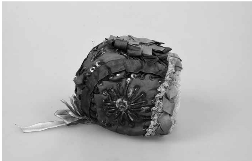
Obr. 5. Taftový křestní čepiček, 1. pol. 19. století. Muzeum Vysočiny Pelhřimov, inv. č. T954.

v unifikovaném střihu, ale především v barvě. Ve druhé polovině 19. století se i na čepičkách stále častěji objevují odstíny bílé. V této době se rovněž stávají populárními čepičky s kabátky zhotovované z tylu. Jemný materiál bývá zdoben vyšívánými či vytkávanými ornamenty (geometrické či florální motivy), stuhami, krajkami a volány. Jen zřídka zde našly uplatnění netextilní aplikace. Zpravidla bývaly podkládány hedvábím, saténem, později bavlnou. U tylového čepičku, který je součástí pelhřimovské sbírky, je podklad hedvábný. 68 Zdobné prvky zde představují našité růžové a bílé stuhy a nabíraná tylová krajka lemující okraje. Velmi podobným dojmem jako čepičky tylové působí pokrývky vytvořené ze strojové krajky, které byly rovněž podkládány různými druhy textilií. Etnografické oddělení NM disponuje čepičkou zhotovenou na Pelhřimovsku (konkrétně ve Veselém u Počátek) v roce 1881, 69 jenž je podložen růžovým organýtýnem. Zdoben je vedle sámků z tylu také sytější fialovou hedvábnou stužkou, z níž je na temeni vytvořen květ.