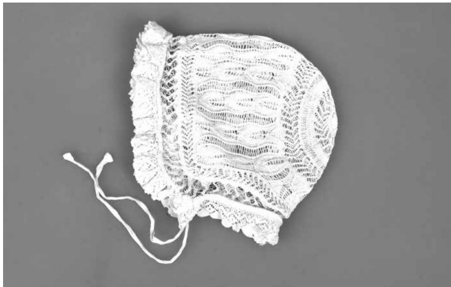
Obr. 8. Pletený křestní čepček, 1. pol. 20. století. Muzeum Vysočiny Pelhřimov, inv. č. T975.

jsou dodnes běžně používané. Jedná se kupříkladu o vzor dvojitých draků, malých svíček, vějířů či zvonečků v síti. Vyjma čepčku, jehož dýnko je tvořeno rozetou s dírkovaným vzorem uspořádaným kolem středové části (Obr. 7) 74 , jsou dýnka tvořena zpravidla osmi, ale i dvanácticípou hvězdou. Jediný čepček je upleten patentovým vzorem soustředěným do pruhů, jež vychází z malého kulatého dýnka. 75 Po obvodu je zdoben lemem z obloučků.