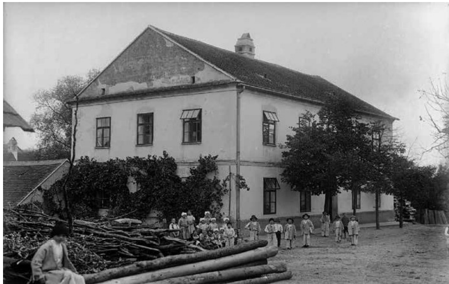
Obr. 2. Děti před školou v Javorníku, 1910.

od útlého věku. Při takto zprostředkovaných informacích je vysoká pravděpodobnost jejich transmise pro další generace. Slovy slovenské etnoložky Margity Jágerové, nemohu být přece hrdý na něco, co neznám a není mi to blízké. 5