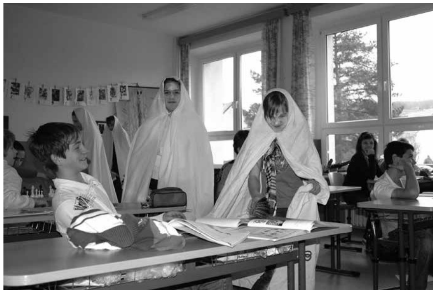
Obr. 4. Obchůzky „lucek“ v základní škole. Kuželov, 2010.