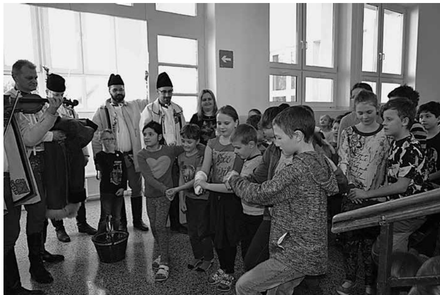
Obr. 5. Fašánek v základní škole. Velká nad Veličkou, 2019.

velické úředníky, Židy – obchodníky, také mzdu, kterou odměňovali Súčovjané svého učitele i tresty pro rodiče, kteří nepovažovali školu za tak důležitou, aby tam děti posílali po celý rok. 19