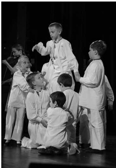
Obr. 9. Dětský folklorní soubor Lúčánek z Louky. Velká nad Veličkou , 2019.

Výzkumy z posledních let prováděné mezi vedoucími a zároveň pedagogy na základních školách na Hornácku ukázaly, že jsou si vědomi nepopíratelných hodnot místní lidové kultury, ale jejich zařazování do výuky není nijak systematické ani pravidelné. Nejčastěji se objevují lidové písně v hodinách hudební