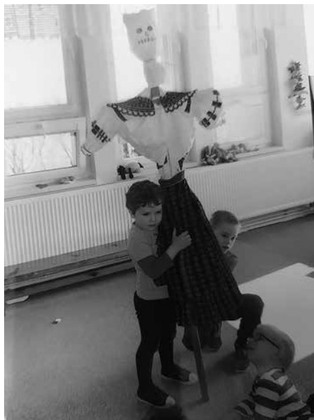
Obr. 8. Vynášení „moreny“ v mateřské škole. Hrubá Vrbka, 2015. Kronika mateřské školy.

národem a povzbuzovat vlastenectví. Vedle učebnic se objevují také první metodické příručky pro konkrétní školní praxi. 31