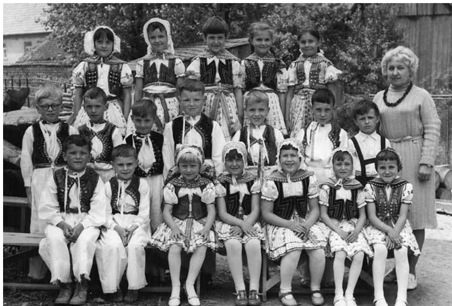
Obr. 3. Školní fotografie. Javorník, 50. léta. 20. století.

o jejich ukončení až v průběhu 18. století, protože i jim samotným se již zdálo koledování nedůstojné, až hraničící s žebrotou. 12