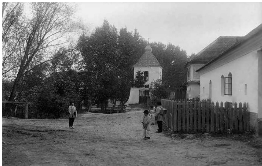
Obr. 1. Děti na cestě do školy. Javorník, 1910.

komunity. Často je neváže ani souvislost s Rámcovými vzdělávacími programy, ale ony přesto navazují na jim známý fakt, že je to právě folklor a další projev lidové kultury, které jsou v souladu se základními didaktickými zásadami – postupovat od známého k neznámému a od blízkého ke vzdálenému, 4 což se v pedagogické praxi velmi osvědčuje.