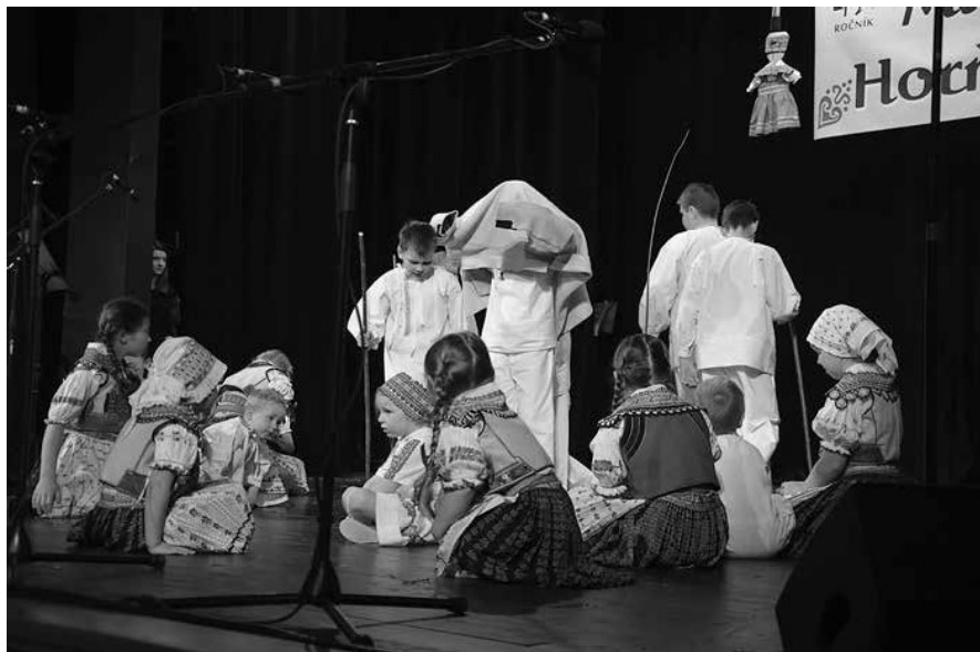
Obr. 10. Národopisný kroužek Javorníček. Velká nad Veličkou, 2019.

výchovy nebo motiv ornamentu či lidového oděvu v hodinách výtvarné výchovy. Výjimečně se ve školách pracuje s lidovým tancem, místní slovesností či hmotnou kulturou, a to i přes to, že na rozdíl od jiných regionů je zde dostatek listinných i hmotných materiálů, pamětníků či objektů odkud lze čerpat informace nebo zařadit jejich návštěvu do výuky.