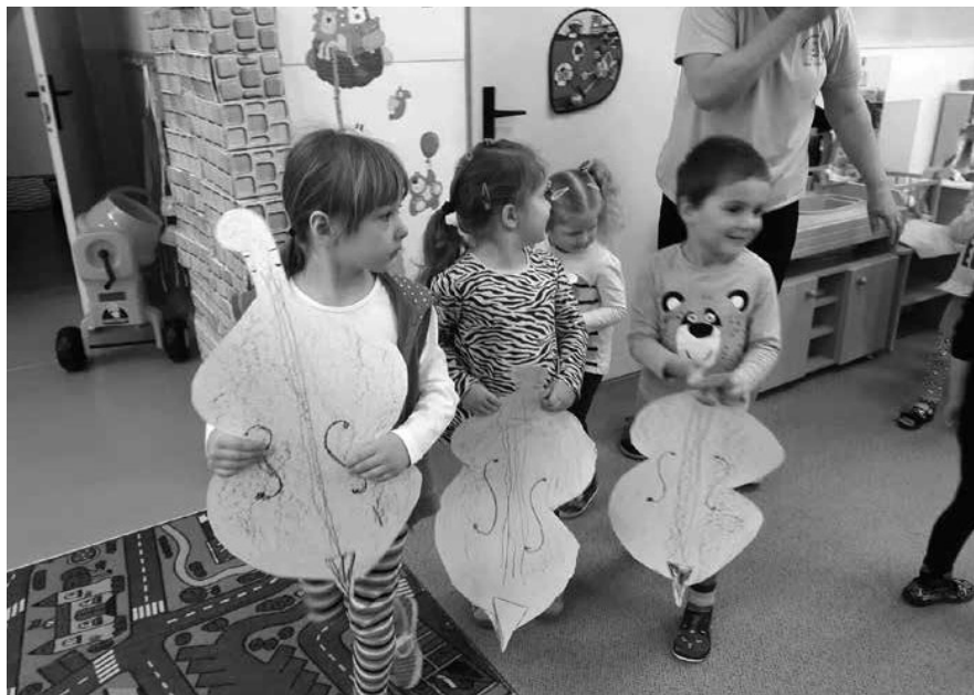
Obr. 7. Pochovávání basy v mateřské škole. Hrubá Vrbka, 2021. Kronika mateřské školy.

prvky z přirozeného prostředí venkovského dítěte. 30 Dětem byly bezprostředně známé a učitelé je začali používat jako výchovného a vzdělávacího prostředku. Lidová kultura se rovněž stala východiskem pro poznání kořenů národní kultury a prostředkem k vlastenecké výchově.