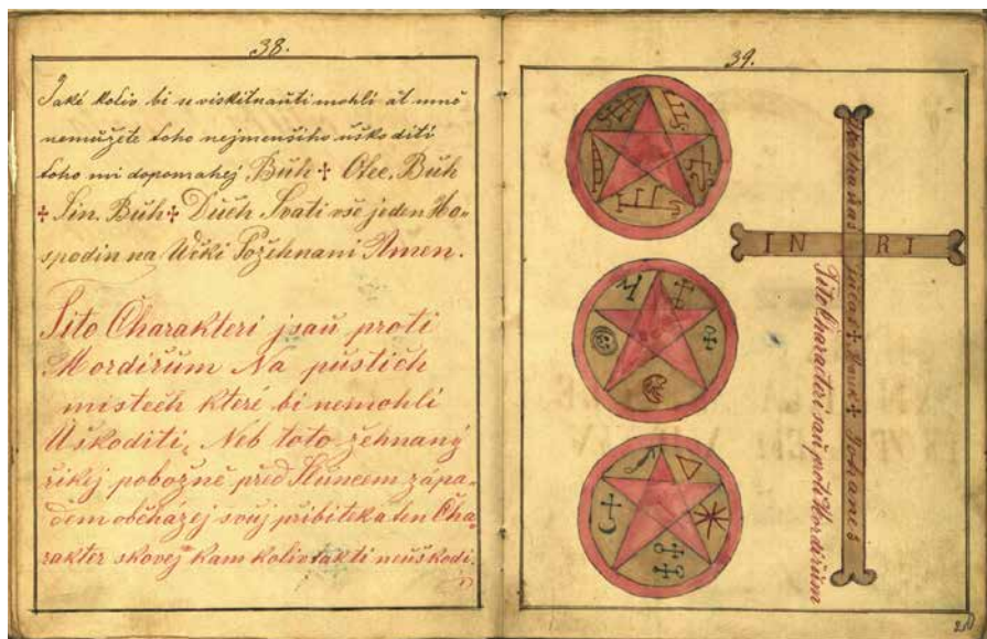
Obr. 3. Magické pečeteť proti mordýřům s textem zaklínání. Knihovna Národního muzea Praha, sig. I H 53, s. 38–39.

typu „aby tobě žádný při veselosti uškoditi nemohl“ 55 je patrná obecně rozšířená obava z možné újmy (ublížení, očarování), kterou by mohl člověku způsobit někdo z přítomných. Proti očarování nebo třeba otravě se bylo možné preventivně chránit hlavně prostřednictvím amuletů, často s pomocí hadí kůže, jazyku nebo žahadla.