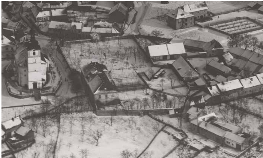
Obr. 4. Letecký snímek prostoru kostela, zámku a bývalého vrchnostenského dvora (vpravo) ve Velkém Týnci z doby mezi lety 1934 a 1935. SOkA Olomouc, fond Sběrka obrazového a fotografického materiálu SOkA Olomouc, sign. XIV/123, inv. č. 1525.

areálu i v následujícím období dosvědčuje letecký snímek z roku 1934/1935 (obr. 4). 26 Podle něj sice v prostoru bývalého nádvoří vznikly některé menší stavby, základní členění na dříve vzniklé dominikální usedlosti a domy však zůstalo zachováno. Teprve druhá polovina 20. století začala přinášet větší proměny zástavby tohoto areálu. Jednalo se zejména o úplný zánik rozsáhlé budovy sloužící jako hospodářské zázemí zámku, vznik silnice vedoucí přes samotný dvůr, po roce 2001 i zboření domu čp. 137 27 (dnes čp. 710) a hospodářských budov u nemovitosti čp. 122 (dnes čp. 178) a jejich nahrazení moderní zástavbou, jakož i výstavbu novostavby rodinného domu v prostoru již zmiňované hospodářské budovy, která byla součástí zámeckého areálu. Současný stav tak dosud částečně zachovává dispozici původního vrchnostenského dvora a jeho připomínkou je i název ulice, jež jím v současnosti prochází (Dvůr). Zejména v posledních dvaceti letech je ale tento prostor značně narušován postupnými stavebními úpravami, které často vedou k nevratným změnám tohoto specifického dokladu transformace vrchnostenského dvora na svěbytnou vesnickou čtvrtě.