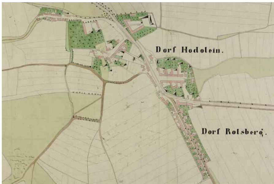
Obr. 1. Nedatovaná mapa vesnic Hodolany a Rolsberk pravděpodobně z 20. nebo 30. let 19. století. SOkA Olomouc, fond Sbirka map a plánů SOkA v Olomouci, sign. XXXII/17.

vytvářely značnou poptávku po pracovní síle. 11 V důsledku toho zaznamenal Rolsberk na přelomu 19. a 20. století čilý stavební ruch, o čemž nás poměrně dobře informují prameny o soukromé výstavbě zachované ve fondu archivu města Hodolan. 12 Z nich se dovídáme, že v této době docházelo k výraznému zahušťování zástavby, kdy byly zastavovány mezery mezi jednotlivými usedlostmi, 13 nové byty vznikaly také jejich výstavbou ve dvorech. 14 Z dokumentace také zjišťujeme, že některé domy byly kompletně demolovány a nahrazeny novostavbami. 15