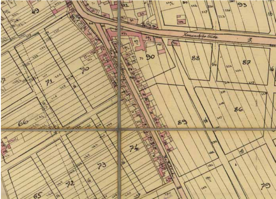
Obr. 2. Mapa projektovaných ulic v oblasti vesnice Rolsberk z roku 1910. SOkA Olomouc, fond Sbirka map a plánů SOkA Olomouc, sign. I/55.

dokládá i projektování uliční sítě v jejím okolí zobrazené na mapě z roku 1910 (obr. 2). 16 Na místech obdělávaných pozemků měly nově vznikat obytné plochy a nadále docházelo i k rozšiřování průmyslových objektů. K narušení stavebního uspořádání vesnické zástavby došlo na konci dvacátých let 20. století při výstavbě orlovný, nacházející se na rozhraní mezi Hodolany a Rolsberkem. Ta byla potom na začátku čtyřicátých let 20. století přestavěná na divadlo. 17 V osmdesátých letech 20. století již narušenou dispozici vesnice ještě více poškodilo vybudování křižovatky u tohoto divadla, která prochází severní částí rolsberské obce. Do dnešní doby tak zůstala zachována jen jižní část původní vesnice, navíc významně přestavěná v průběhu 19. a 20. století. Na specifickou historii této lokality ale dodnes upozorňuje název ulice (Rolsberská).