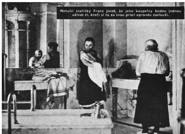
Obr. 2. Dobová popiska: „Netušil staříček Franz Josef, že jeho koupelny budou jednou uživat ti, kteří si to za svou práci opravdu zaslouží.“ Beseda venkovské rodiny z 13. října 1950.

pokryt. 29 Naopak od podzimu 1950 přibýlo deset turnusů desetidenní pražské rekreace pracovníků JZD. 30 Svaz také uspořádal rekreaci pro vítěze ankety časopisu Beseda venkovské rodiny . Jelikož se jednalo o nejstarší zemědělce, musel být pro ně připravený zvláštní formát v grandhotelu Pupp. 31 Ve všech střediscích probíhaly rekreace až do jara 1952, kdy proběhlo rychlé rozpuštění svazu. Od podzimu převzalo organizaci rekreací samo ministerstvo zemědělství, konkrétně hlavní správa JZD. 32