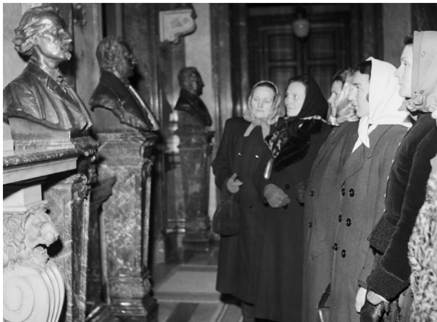
Obr. 1. Inscenovaná fotografie rekreaterek (zemědělských matek početných rodin) v Národním muzeu. 25. 1. 1949.

Na základě dalších ministerských pověření začal JSČZ od ledna 1948 pořádat v Praze pravidelné týdenní pobyty zemědělců a od ledna 1949 rekreace zemědělských matek početných rodin. 24 Program obou rekreací byl téměř totožný. 25 Na jaře 1949 uspořádal JSČZ ve spolupráci s ČEDOKem pro obyvatele venkova poznávací akci „Tři dny v Praze“. Vycházela ze zkušeností s podobným formátem, který cestovní kancelář realizovala nepřetržitě od roku 1933. 26 Vybraným zemědělcům pobyt hradil svaz, ostatní se mohli připojit na vlastní náklady. Akce se setkala s nezájmem zemědělců, a tak se svaz zaměřil na ministerské, plně hrazené rekreace. V lednu 1950 zřídil rekreační středisko v Karlových Varech 27 a následujícího roku ve Špindlerově Mlýně. 28