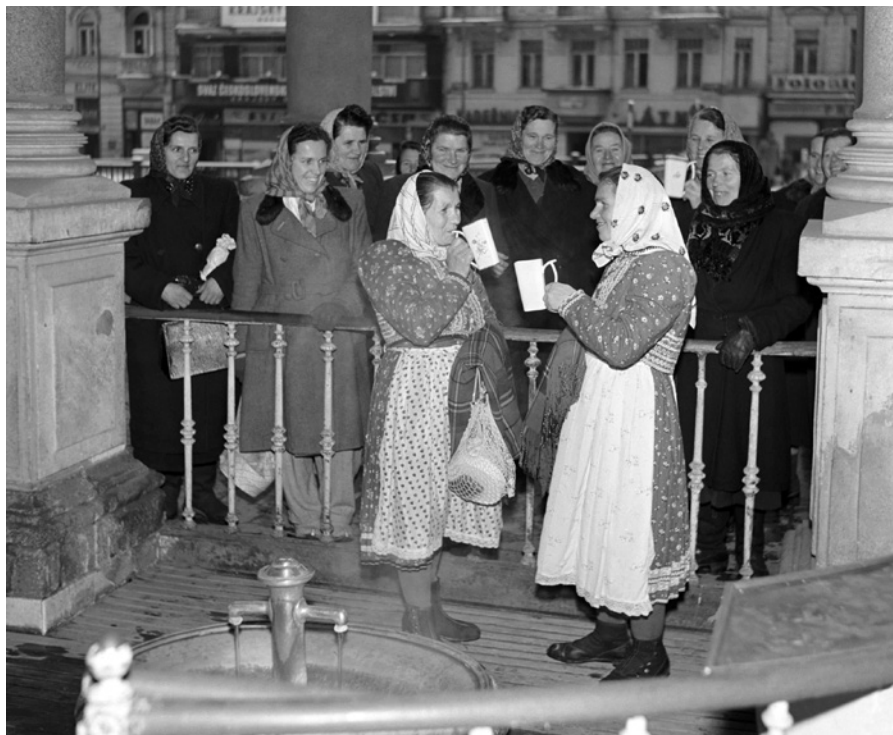
Obr. 6. Inscenovaná fotografie zvýrazňující jinakost oděvu a dobrou náladu rekreatek u karlovarského pramene. 18. 12. 1950.

přičemž některé jej popisovaly jako nejkrásnějších 10 dní svého života. Z drtivé většiny dopisů však vyplývá, že pisatelky nezpochybňovaly politické a hospodářské teze, jak jim byly v Praze prezentovány, naopak je internalizovaly a učiněné závazky plnily. Reakce okolí však nebyly již tak jednoznačné. I když většinou jim bylo dopřáno sluchu na různých schůzích, nebylo tomu tak všude, a to ani mezi ženami-spolupracovnicemi.