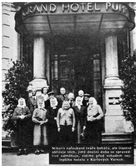
Obr. 3. Dobová popiska: „Nikoliv nafoukané tváře boháčů, ale šťastné obličejе těch, jimž dnešní doba spravedlivě se odměňuje, vidíme před vchodem nejlepšího hotelu v Karlových Varech.“ Beseda venkovské rodiny z 13. října 1950.

Po únoru 1948 začaly ovlivňovat průběh rekreací politika KSČ a její snahy o proměnu sociální imaginace. Od podzimu přibýly odborné diskuze s redaktory zemědělského tisku, představiteli JSČZ a ministerstva zemědělství. Při výběru divadelních her začal být určující jejich socialistický charakter. Podzim 1949 přinesl politické přednášky