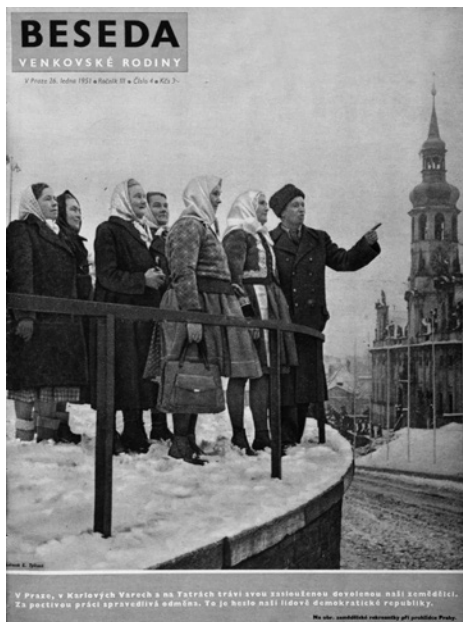
Obr. 4. Při obrazové prezentaci rekreace zemědělských žen v Praze hrál často hlavní roli vesnický oděv. Obálka časopisu Beseda venkovské rodiny z 26. ledna 1951.

álního vývoje 38 . Politické otázky doby a její požadavky tak byly zjednodušovány a prezentovány rekreantům „způsobem pro ně přijatelným“ 39 . Dobové dokumenty hovoří o trpělivém vysvětlování všech jejich otázek, 40 což jen připomíná nárokování nadřazené pozice referujících i pořadatelů. Takovou představu utvrzovaly zjištění o tom, že rekreanti nechápali tzv. „pokroková divadelní představení“, filmy, 41 ale ani hudební koncerty. 42 Např. nejoblíbenější hru rekreantů v Karlových Varech, Jan Hus, „správně“ pochopila podle zpráv necelá 1/5 z nich. 43 To vedlo později k prezentaci obsahu a významu jednotlivých kusů před jejich zhlédnutím i k následné interpretaci významu