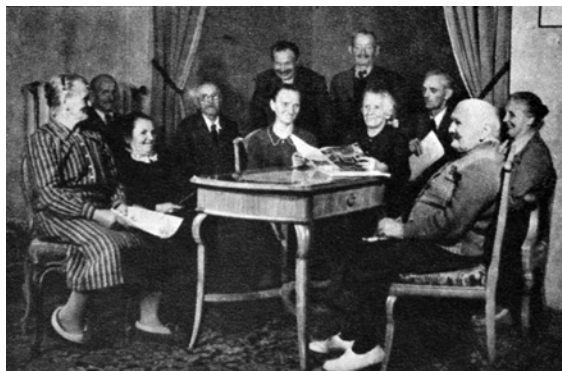
Obr. 7. Z textu: „A tady v salonku hotelu Pupp v Karlových Varech máme naše staříčké rekreaty. [...] Starouškové nevědí, jak vyjádřit svoji vděčnost. [...] Tě radosti, že na ně – staré nebylo zapomenuto. ‚Jak se vám odměníme, jak se odsloužíme vládě a panu ministrovi Ďurišovi?‘ To jsou jejich otázky, jejich dnešní starost.“ Beseda venkovské rodiny z 13. října 1950.

sledovaly se „zatajeným dechem“ a dojímalý je osudy jeho obětí. 89 Takové emoce zapadaly do záměrů autorů, vidění komunistického režimu i celé sociální imaginace. Osvojením nového afektivního chování docházelo i k jeho změnám, když ženy ztrácely strach vštěpovaný patriarchální společností: „pokorné bázně jsem se vzdala, poznala jsem pevnost, sílu svou [k socializaci vesnice]“ 90 . Rekreatky ale také vyjadřovaly emoce, které vycházely z jejich sdílené identity. Dotýkalo se jich líčení submisivního postavení žen v minulosti, opovrhovaly přehlížením práce, vyjadřovaly radost nad reflexí práce žen i problémů při socializaci vesnice. 91